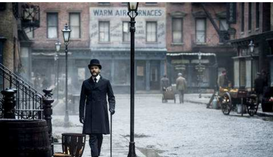
Adolf Loos, el revolucionario arquitecto de interiores