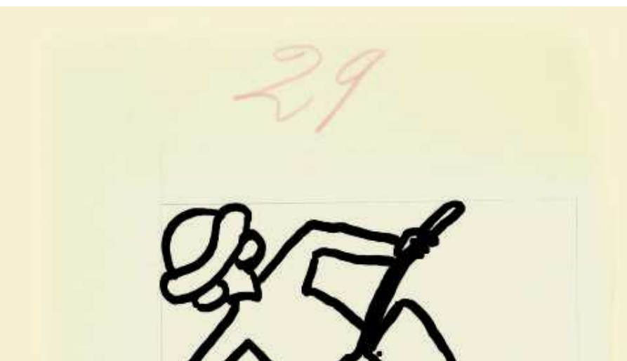
Inspiración literaria: casas y librerías detrás de los libros de Cervantes, Shakespeare y otros