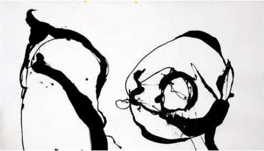
• '¿Qué pinto aquí?', las transgresiones de Jesús de Miguel